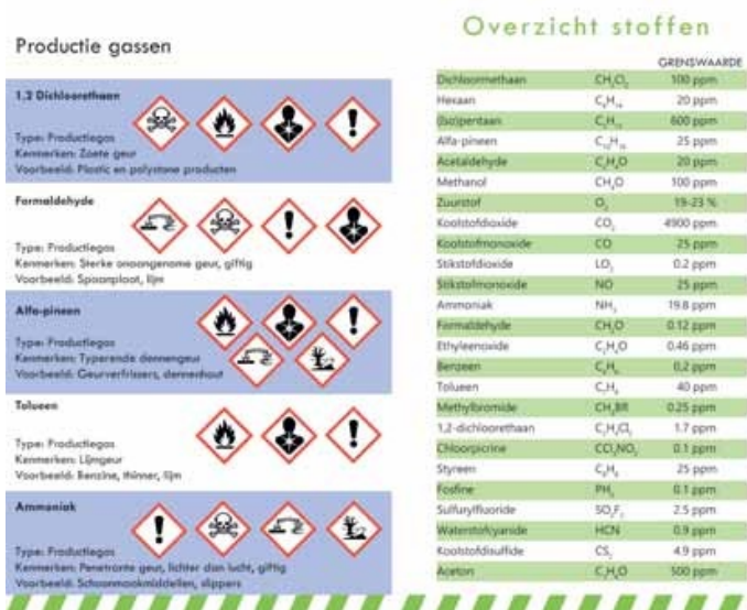
Figuur 3 Voorbeeld van een informatieblad

De Nederlandse versie van het actieplan gebruikt gedetailleerde stroomschema's (zie figuur 4) voor de veilige behandeling conform de drie containercategorieën, en verwijst naar zogenaamde 'tipkaarten' over verschillende procedures.